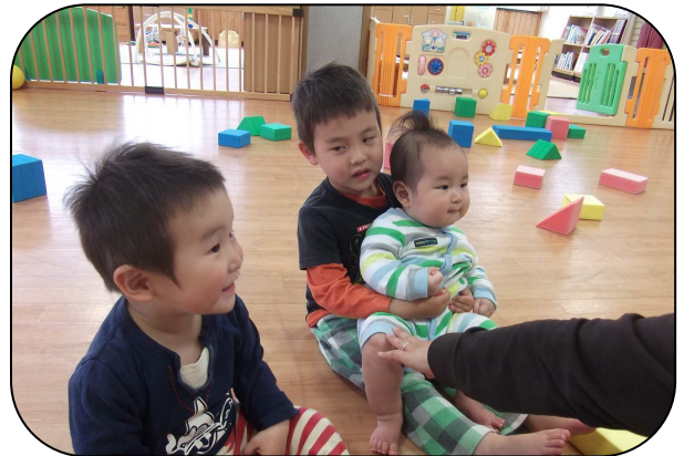
よその赤ちゃん、抱っこしてみたけど、だいじょうぶかな？ 弟とはちょっと違うけど