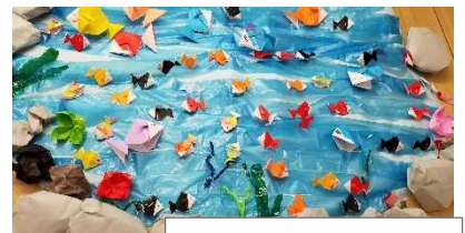
壁に金魚の池を作りました