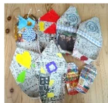
← 新聞紙で作った防災スリッパ

毎日の活動の中で子どもたちが製作した作品の一部をご紹介します。同じテーマでもそれぞれに個性あふれる「ひとつだけ」の素敵な作品がたくさん出ています。